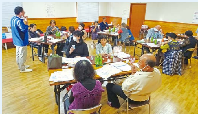
口腔ケアを学び、とろみ食の試食

高齢者の健康づくりや介護予防に関心のある14人が受講し、運動・栄養・口腔ケア・介護・認知症予防等、自分だけでなく、周囲の人にも活用できるさまざまな知識を学びました。