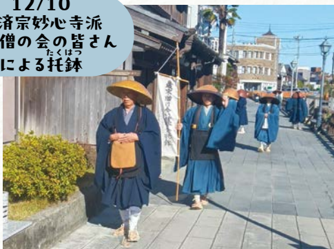
12/10 臨済宗妙心寺派 青年僧の会の皆さん による托鉢

皆さまからお寄せいただいた善意の募金は「じぶんの町を良くするしくみ」のための福祉活動に活用させていただきます。ありがとうございました。共同募金の実績は次号でお知らせいたします。