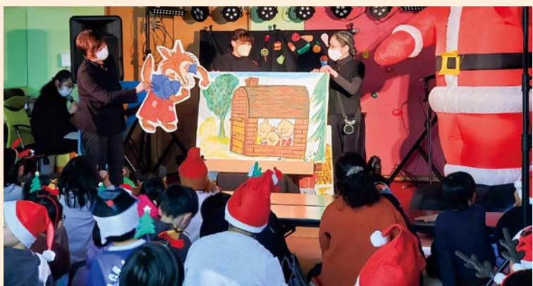
飛び出すオオカミにみんなドキドキ