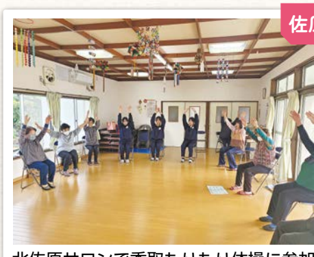
北佐原サロンで香取もりもり体操に参加

さらに、障害者施設での秋祭りの飾り付けや地域の花壇整備をボランティアの皆さんと一緒に取り組んだほか、紙オムツ配達への同行などを通じて福祉の現場を直接体験しました。