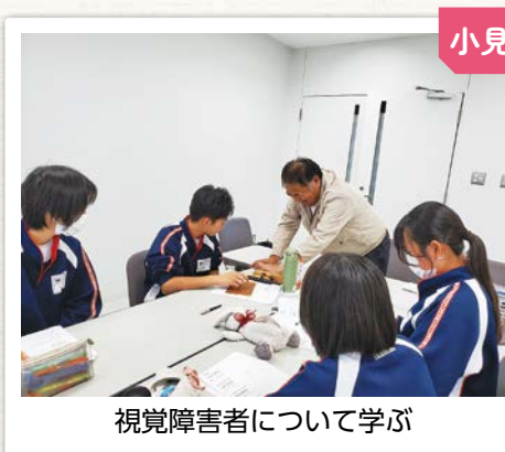
視覚障害者について学ぶ