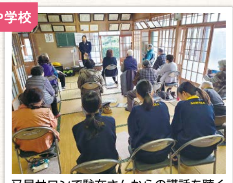
又見サロンで駐在さんからの講話を聴く