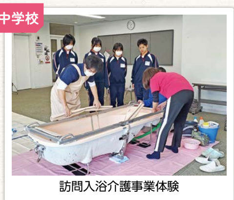
訪問入浴介護事業体験