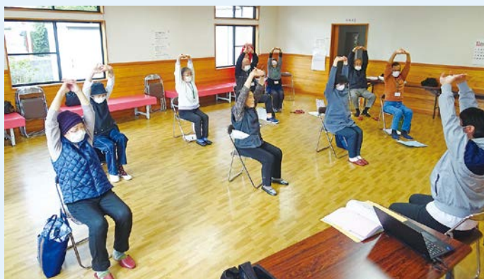
フレイル予防体操の実践