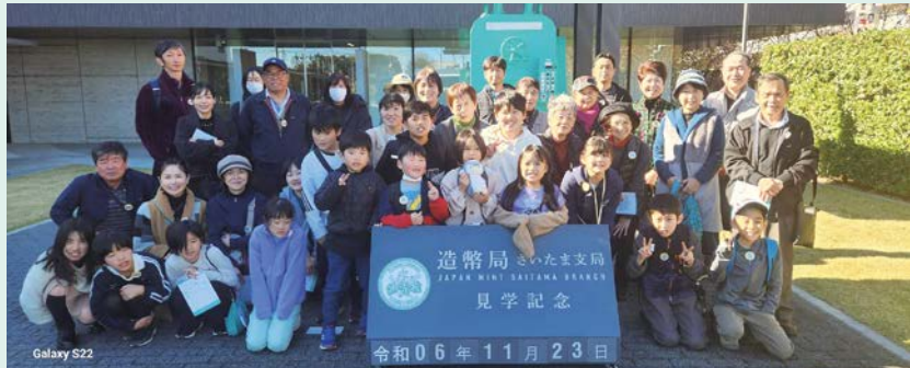
造幣さいたま博物館の前で「ハイポーズ」

参加者の年齢層も幅広く、バスの中では子どもたちの声がたくさん聞こえて、楽しい一日となりました。