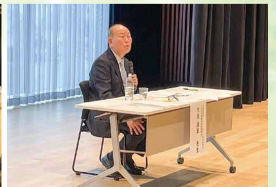
大橋様による講演会