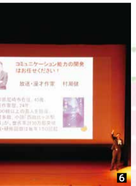
1 竹蓋会長から主催者あいさつ 2 伊藤香取市長による来賓祝辞 3 会長から表彰状の授与 4 受賞者代表による謝辞 5 優秀作文を発表する受賞者 6 記念公演では人とのコミュニケーションのとり方を学ぶ