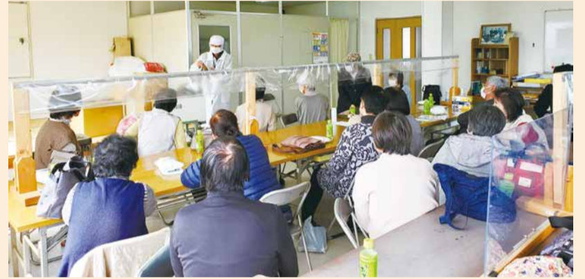
削り節の香りも楽しめました♪

昼食は、栗源地区の「恋する豚研究所」でしゃぶしゃぶやスチームハンバーグをいただきました。この施設では、障害がある人たちが商品の製造に携わっていて、一人一人が特性に合わせて、生き生きと働いている様子がよく分かりました。「食」に関して深く考えさせられ、これから「食べる」ことに改めて感謝していこうと気付かされた一日でした。