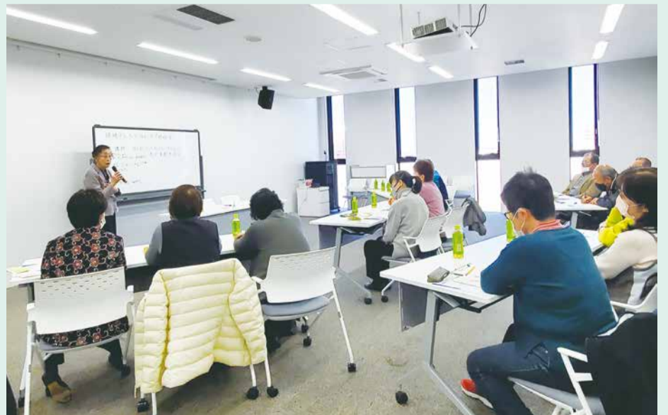
熱心に講義を聴く傾聴ボランティアの皆さん

はじめに認知症を患った夫を取り巻く家族の実話を題材に家族それぞれの気持ちを考えました。次に、話す人、聴く人、観察する人すべての役になってみることで、本人や家族の気持ちに寄り添い共感することが、傾聴の大切なポイントであることが分かりました。今後、さまざまな場面で、このような聴き方「傾聴モード」を活用していきたいと思います。