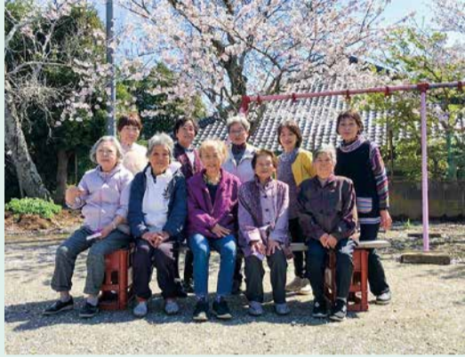
お花見会での記念撮影

長岡青年館でもりもり体操を中心にサロン活動をしている長岡にこここクラブ。免許を返納し買い物に困っているという参加者の声から、移動販売車「とくし丸」が訪問するようになりました。毎週月曜日のとくし丸訪問日には会員以外の地域の方も大勢集まります。「買い物だけでなく、ここに来るとみんなに会えて嬉しい」と笑顔で語る皆さん。心地よい風に舞う桜の花びらを眺めながら、楽しいおしゃべりに花が咲きました。